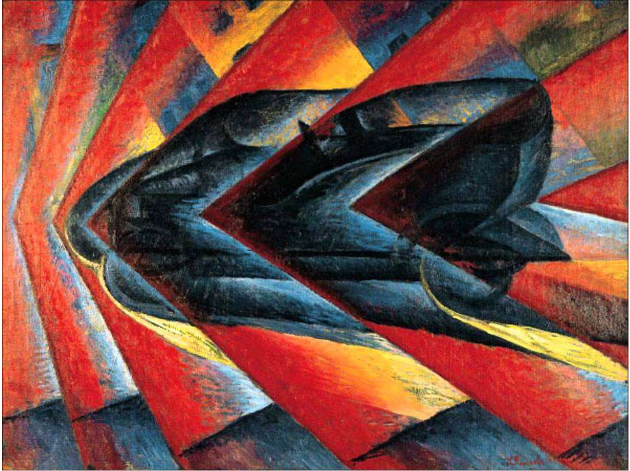
Luigi Russolo, Dinamizam automobila, 1913.