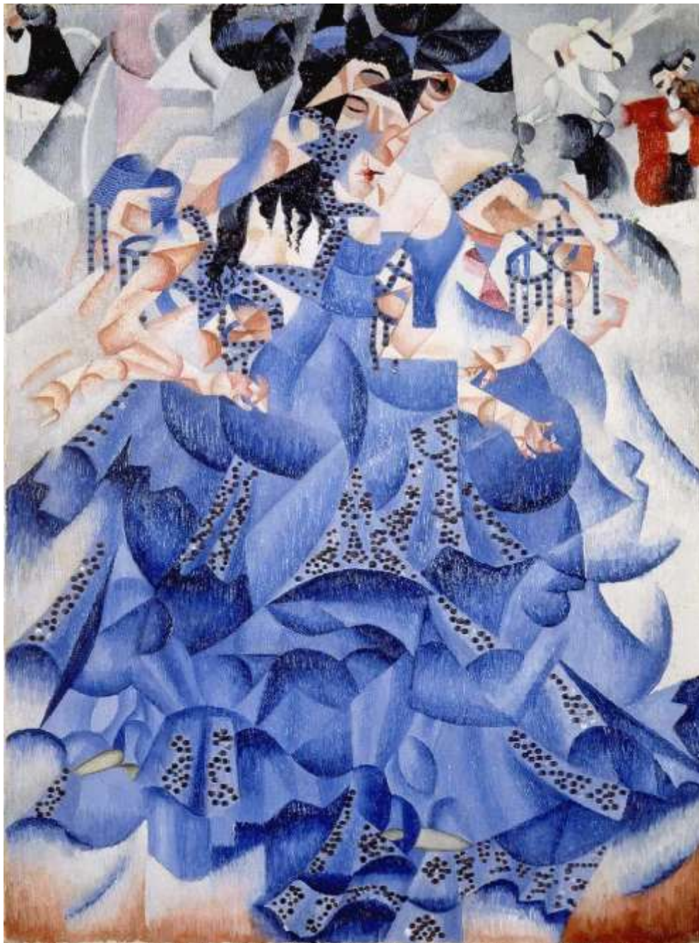
Gino Severini, Plava balerina, 1912.