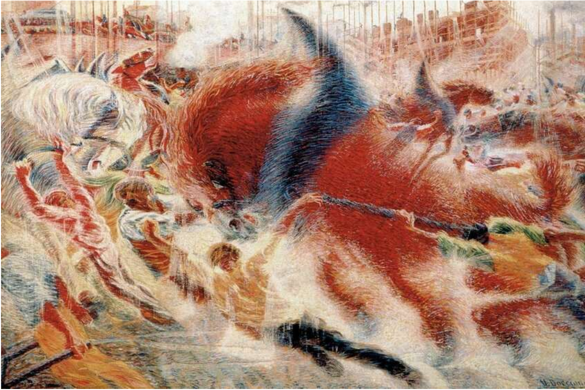
Umberto Bocciono, Uzdizanje grada, 1910.