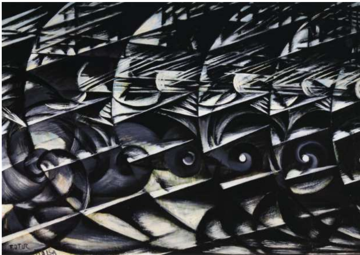
Giacomo Balla, Apstraktna brzina, 1913.