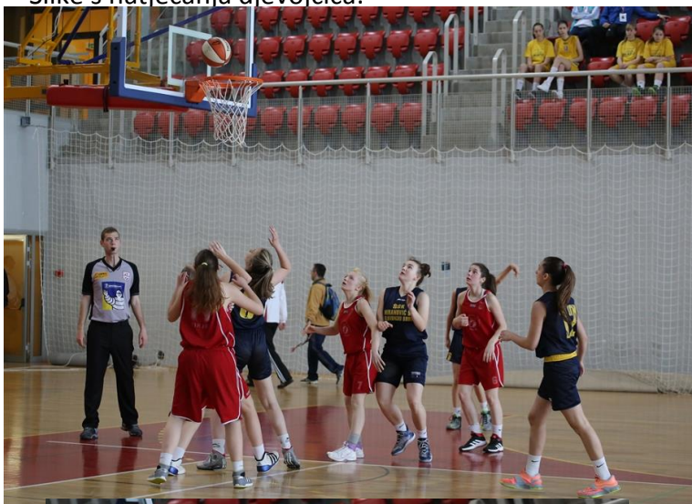
Slike s natjecanja djevojčica:

Poreč 29., 30. travnja i 1. svibnja 2015.